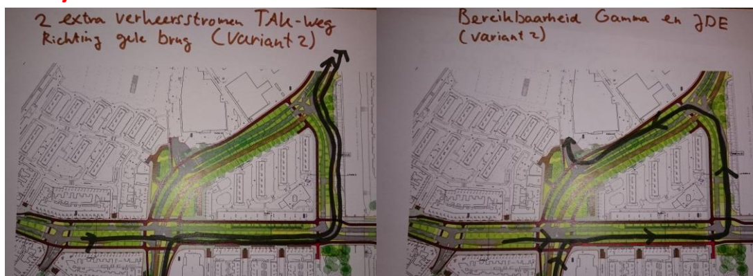
Figuur 1: 2 extra stromen TAK-weg, variant 2 Figuur 2: Bereikbaarheid Gamma, JDE variant 2

Het gevolg is dat meer verkeer door de TAKweg en langs het plantsoen wordt geleid en daarmee voor ruim 200 mensen waarvan de helft kwetsbaar, nadelige gevolgen heeft en juist directe significante verbetering laat liggen, dit wordt uit de visualisaties van de projectgroep niet duidelijk.